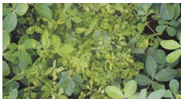
Planta con síntomas de virosis

El cultivo de maní es afectado por distintas virosis que producen pérdidas de rendimiento y calidad de los granos cosechados. La virosis que se encuentra con mayor dispersión en la provincia de Córdoba es producida por un potyvirus llamado Peanut Mottle Virus (PeMoV) . El mismo se transmite por medio de la semilla y pulgones. El control es preventivo y comienza con la siembra de semillas libre de virus. En los últimos años se ha observado un incremento de plantas afectadas por un tospovirus llamado Groundnut Ringspot Virus (GRSV). Este virus se transmite solamente por trips. Cuando las infecciones son tempranas, los síntomas son más severos, pudiendo incluso provocar muerte de plantas.