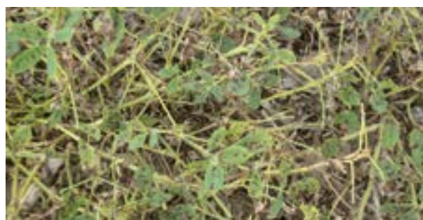
Intenso ataque de viruela tardía

La viruela temprana, Cercospora arachidicola y la viruela tardía, Cercosporidium personatum , son las enfermedades foliares más comunes del cultivo de maní. Producen defoliación, debilitamiento de tallos y de clavos y en consecuencia, reducción en los rendimientos, lo que se agrava cuando se demora el arrancado. Estas pérdidas pueden ser evitadas con un adecuado programa de control de la enfermedad. La oportunidad de la primera aplicación y el intervalo de tiempo entre aplicaciones deben ser respetados rigurosamente. Si por condiciones ambientales adversas no se puede entrar al lote con equipos terrestres, recurrir a la aplicación aérea.