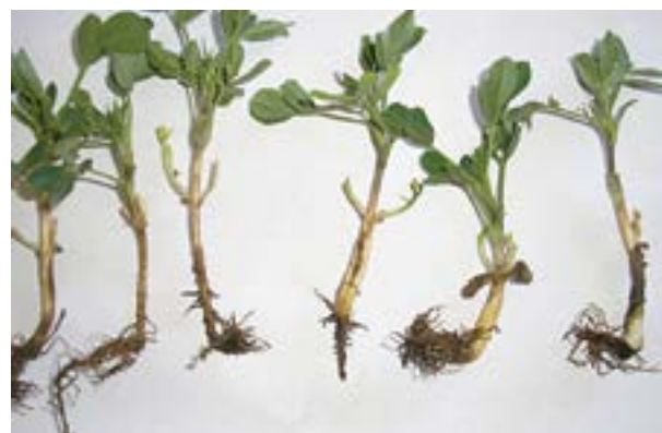
Plántulas con daños en raíces por hongos del suelo

Las enfermedades que se desarrollan sobre o debajo de la superficie del suelo son de difícil diagnóstico.