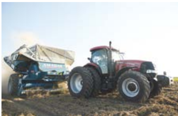
Descapotadora de doble hilera

Cuando se dispone de facilidades para secar la producción, la cosecha puede realizarse cuando el maní tiene entre 18 y 22 % de humedad. Si el maní será almacenado en el campo sin previo secado artificial, la humedad del maní no deberá superar el 10%.