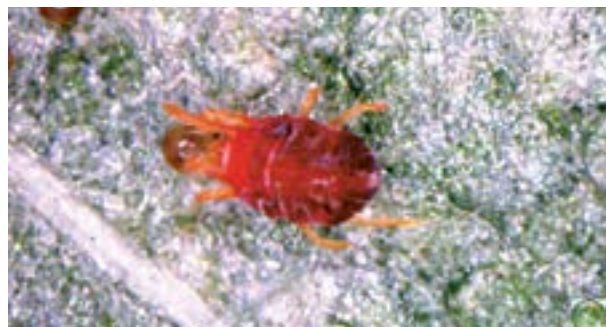
Arañuela adulta y huevos

Las arañuelas ( Tetranychus sp. ) producen daños a la planta al succionar el contenido de las células desde el envés de las hojas. La presencia de arañuelas se observa en manchones dentro del lote, especialmente a lo largo de las cabeceras, mostrando las plantas un aspecto amarillento grisáceo. Cuando el ataque es intenso las plantas mueren.