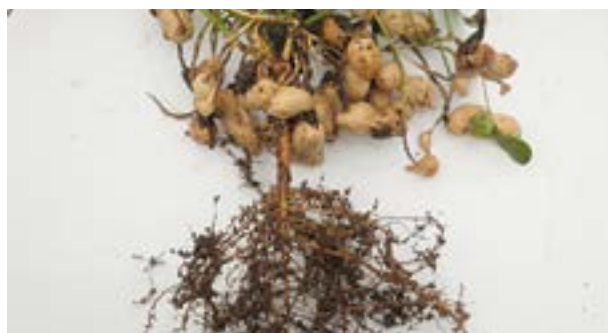
Síntomas de nematodos en raíces y vainas

El agente causal encontrado es Meloidogyne arenaria , nematodo formador de agallas en raíces, clavos y vainas. En el tejido vascular afectado de las distintas partes de la planta se interrumpe el paso de agua y nutrientes afectando el normal crecimiento y en consecuencia disminuyendo los rendimientos. Si bien se han encontrado lotes atacados en la zona de General Cabrera, no se ha comprobado la difusión en el resto del área manisera.