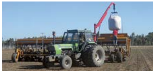
Carga de semilla en una sembradora neumática

judica tanto el manejo agronómico como el valor comercial del producto cosechado. La semilla de maní es muy susceptible a alteraciones por lo que el manipuleo debe ser muy cuidadoso.