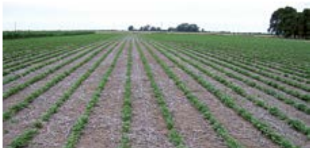
Siembra de maní en siembra directa sobre soja

En la rotación de cultivos, el maní debe incluirse cada cuatro o más años.