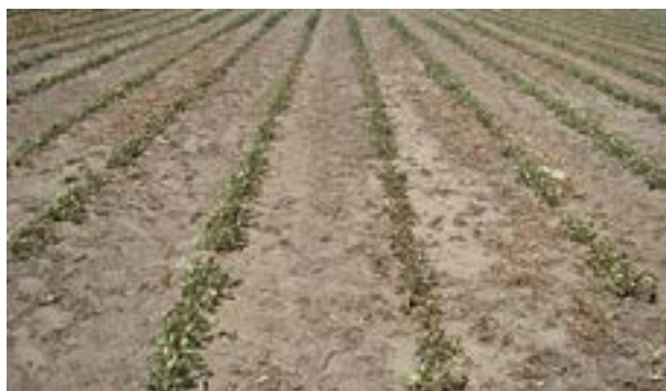
Sequía en primera etapa de crecimiento del maní

El maní tiene varios mecanismos fisiológicos para evitar los efectos de un estrés hídrico y un sistema radicular muy extendido que le permite la búsqueda de agua en profundidad.