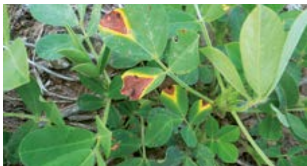
Hoja con síntoma de mancha en V

Se presenta como manchas de forma triangular y de color castaño en el extremo de los folíolos, extendiéndose hasta cubrir la mitad o más de la superficie foliar. El agente causal, Leptosphaerulina crassiasca , es un hongo necrotrófico, sólo fructifica sobre tejido vegetal muerto, por lo que es común observar su incremento después de aplicaciones de herbicidas con aceites que producen fitotoxicidad y necrosis de tejidos.