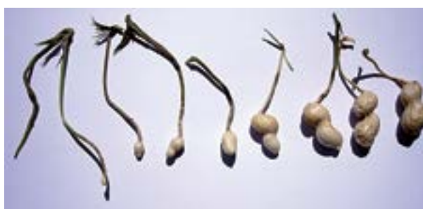
Evolución de "clavo" a vaina

El maní crece bien en suelos profundos, bien drenados, ligeramente ácidos, donde desarrolla un amplio sistema radicular.