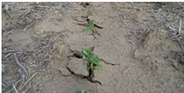
Nacimiento de maní

correctamente las malezas, evitar sembrar en lotes con horizontes endurecidos o irregularidades muy pronunciadas del terreno.