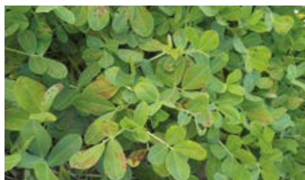
Fitotoxicidad por plaguicidas

La primera aplicación de fungicidas coincide generalmente con la aplicación de herbicidas gramínicas que controlan los “escapes” de malezas gramíneas o de maíz “guacho”. Es conveniente evitar la pulverización simultánea de fungicida con herbicidas, ya que la mezcla puede producir daños por fitotoxicidad desde leves a muy severos.