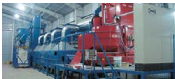
Planta de tratamiento de semillas con polímeros

Todos los fungicidas curasemillas mencionados en la Tabla 2 son formulados líquidos. Para tratar 100 kilogramos de semillas de maní se diluye la dosis de curasemilla en agua, o agua mas aceite vegetal no refinado en partes iguales, hasta completar 0,75 litros.