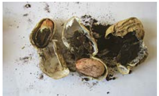
Síntomas de Carbón en maní

Es la enfermedad que ha tenido mayor difusión en el área manisera en los últimos años. El agente causante es Thecaphora frezzii el cual sobrevive en el suelo. Las vainas afectadas son fácilmente distinguibles por una hipertrofia de sus paredes, son de mayor tamaño y en su interior se observa una masa carbonosa con destrucción total o parcial de los granos. Hasta el presente se han evaluado distintas alternativas para su control, como diferentes tipos de labranza, rotaciones, uso de diversos cultivares, fungicidas aplicados a la semilla y al suelo y fertilizantes o enmiendas. Ninguna de estas técnicas ha logrado reducir sensiblemente las pérdidas producidas por la enfermedad.