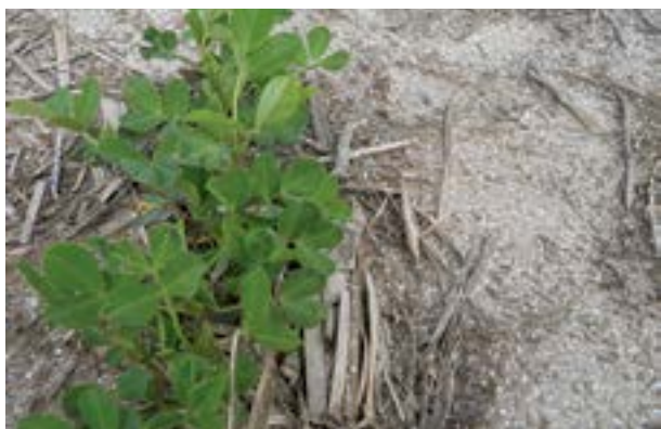
Dolomita en pre floración

Los suelos del área manisera de Córdoba tienen abundante provisión de calcio. No requieren su agregado.