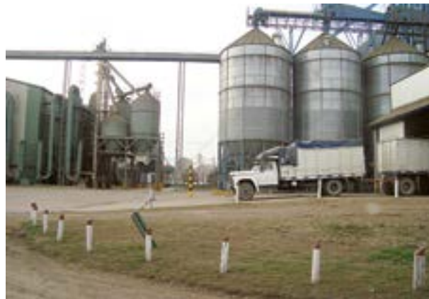
Área de descarga y secado

Actualmente el secado del maní es uno de los pasos más importantes en el proceso de obtención de maní de alta calidad.