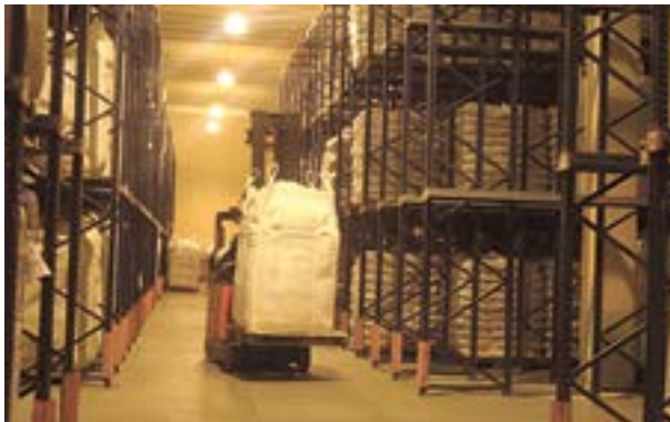
Almacenamiento de maní terminado

Antes del almacenamiento, tan importante como el secado es la prelimpieza para eliminar cajas inmaduras, granos sueltos, raíces, palos, restos de malezas, tierra y cualquier otro material extraño. No debe almacenarse un maní con más de 4% de material extraño o 5% de granos sueltos.