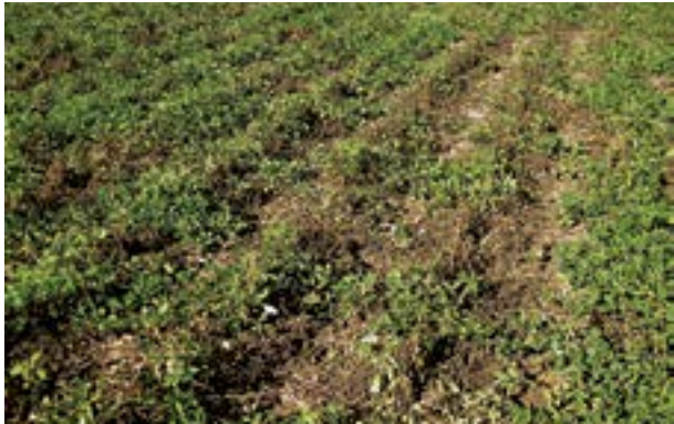
Muerte de plantas por complejo de hongos del suelo

durante la implantación del cultivo, se observa un daño en las raíces que produce un menor desarrollo y/o muerte de las plantas recién nacidas.